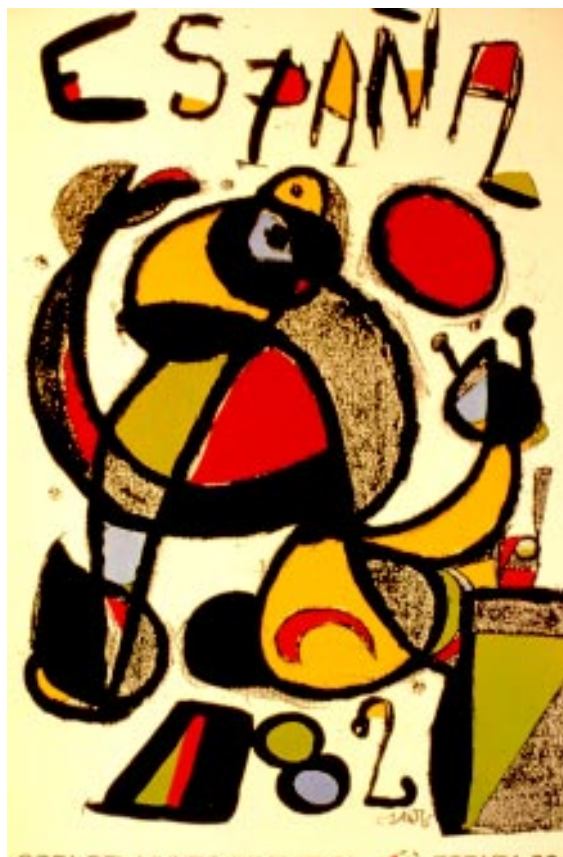
FIGURA 7.- Campeonato Mundial Fútbol. Cartel, 1982

de goma, que todavía utilizan los boxeadores y los jugadores de fútbol; es una goma que se hunde en el cuerpo, y encima un jersey de lana. Esta cosa de goma me hacía sudar mucho. Cuando llegaba a la playa, me sacaba el jersey y esta especie de corsé de goma. Me chorreaba el sudor como agua; después cuando estaba desnudo hacía gimnasia en la playa y me lanzaba al agua y me daba un baño en solitario. Volvía de forma inversa (...) la gente creía estaba loco, considerando que era de Barcelona". Dalí cuenta en su libro Vida Secreta, que Miró le dijo: "Seré duro contigo, pero no te des-