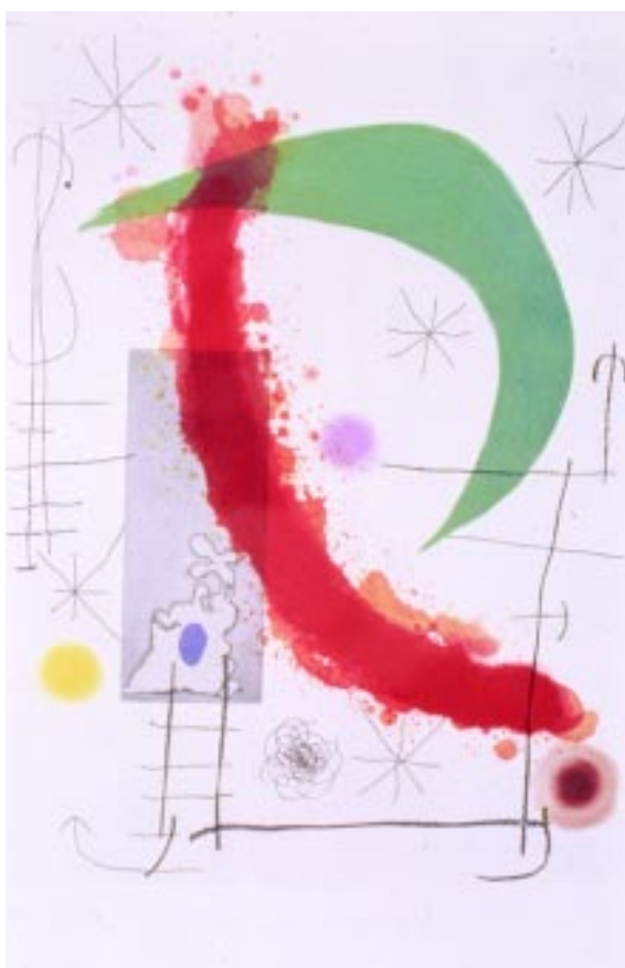
FIGURA 4.- Excursión. Litografía, 1967

vidad en este terreno con el anuncio de exposiciones propias o colectivas, homenajes, congresos, libros y particularmente iniciativas y empresas culturales catalanas, convirtiéndose en el más prestigioso y deseado cartelista mundial. En esta amplia obra existen cuatro carteles destinados a acontecimientos deportivos: en 1974,