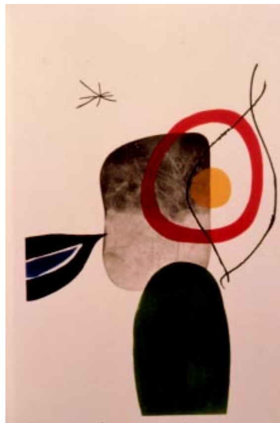
FIGURA 5.- Tiro con arco. Litografía, 1972

vidad en este terreno con el anuncio de exposiciones propias o colectivas, homenajes, congresos, libros y particularmente iniciativas y empresas culturales catalanas, convirtiéndose en el más prestigioso y deseado cartelista mundial. En esta amplia obra existen cuatro carteles destinados a acontecimientos deportivos: en 1974,