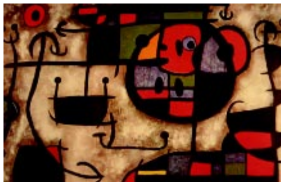
FIGURA 2.- Lección de esquí. Óleo sobre tela