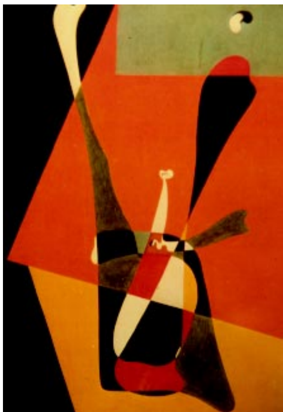
FIGURA 1.- Muchacha haciendo cultura física. Óleo sobre madera, 1932

Un aspecto interesante de la obra de Joan Miró es el cartelismo , en el que se inició en 1919. Es a partir de 1937 que efectuó el famoso Aidez l'Espagne con motivo de la guerra civil española y en 1947 el cartel de la Exposición Internacional del Surrealismo de París, intensificando su acti-