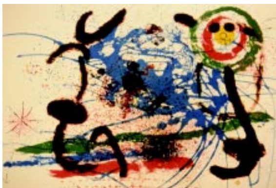
FIGURA 3.- Amazona. Litografía, 1964