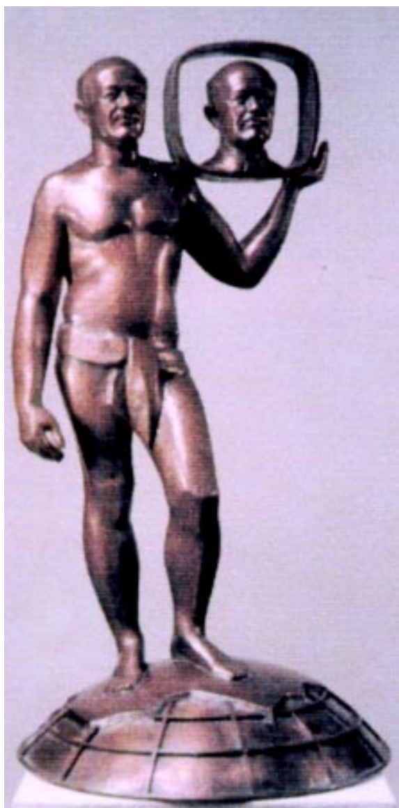
FIGURA 1.- Monumento a Yuri Senkévix