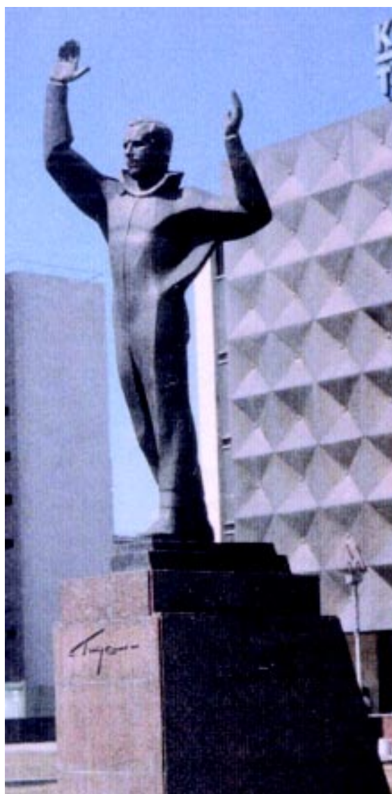
FIGURA 2.- Monumento a Yuri Gagarin