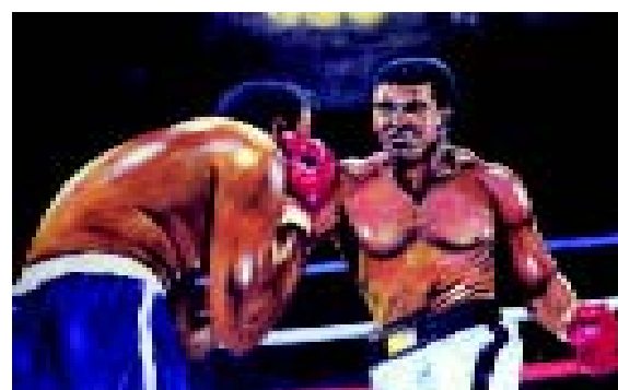
FIGURA 7.- Ali vs. Norton. 1979. Óleo sobre tela

como profesor de Cirugía en el Hospital Mount Sinai de New York ha sido internacionalmente reconocida. Ha publicado numerosos artículos sobre diversos aspectos de la cirugía y tres libros: Atlas of General Surgery (Atlas de Cirugía General) en 1964, Surgical Reflections: Images in Paint and Prose (Reflexiones Quirúrgicas: Imágenes en Pintura y en Prosa) en 1993 y Paintings of Life in the Operating Room: The True World of