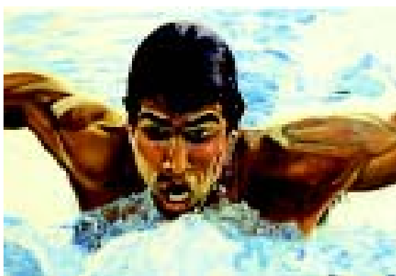
FIGURA 2.- Mark Spitz. 1974. Óleo sobre tela