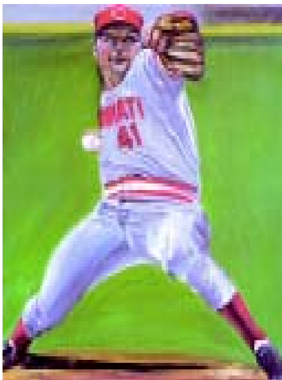
FIGURA 4.- Tom Seaver. 1977. Óleo sobre tela