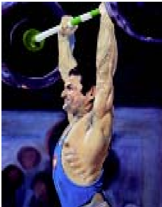
FIGURA 3.- Smalezerz. 1974. Óleo sobre tela