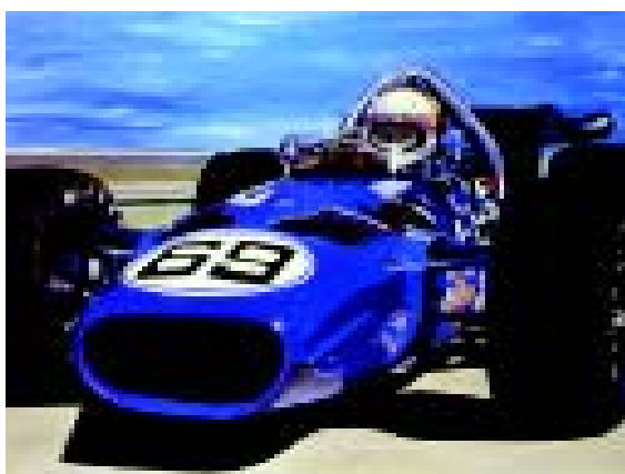
FIGURA 5.- Jackie Stewart. 1978. Óleo sobre tela