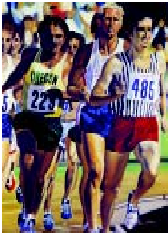
FIGURA 9.- Prefontaine. 1972. Óleo sobre tela