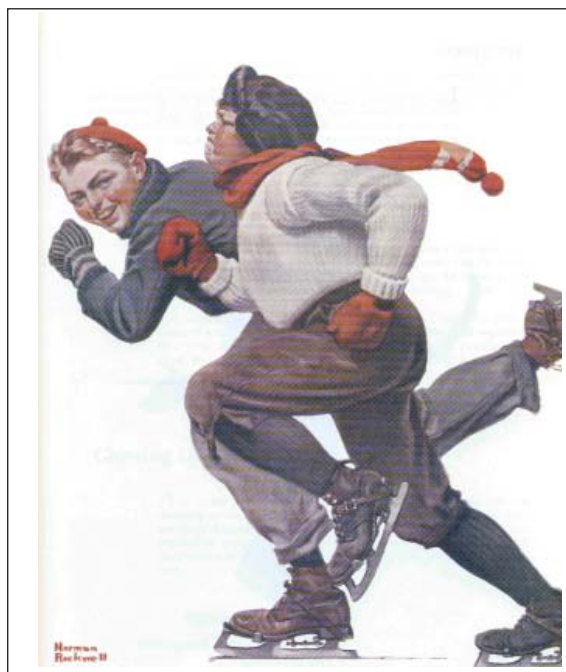
FIGURA 7. Patínaje hielo