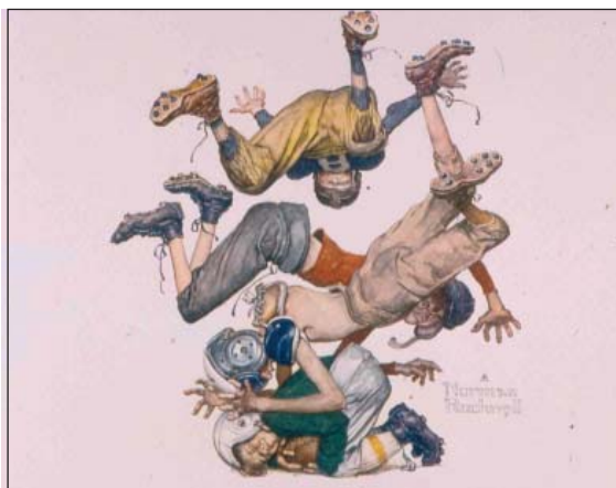
FIGURA 4. Fútbol americano