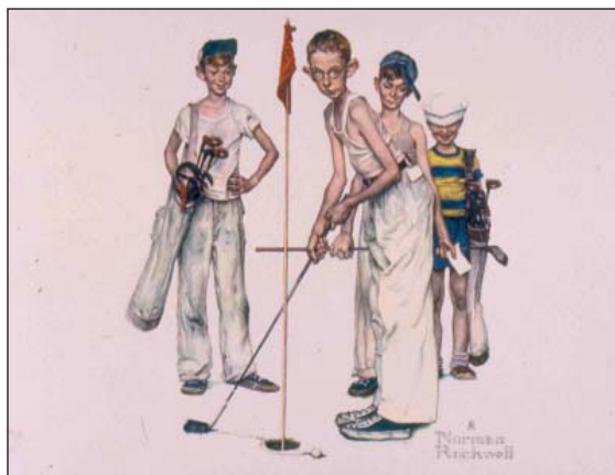
FIGURA 2. Golf