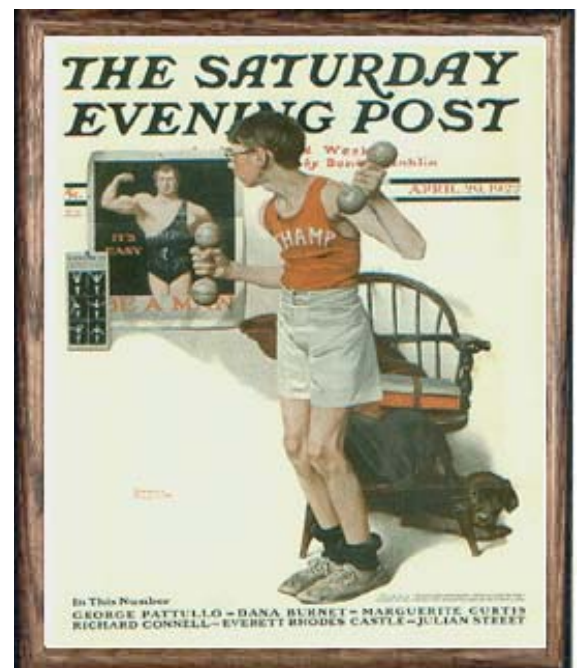
FIGURA 6. Musculación