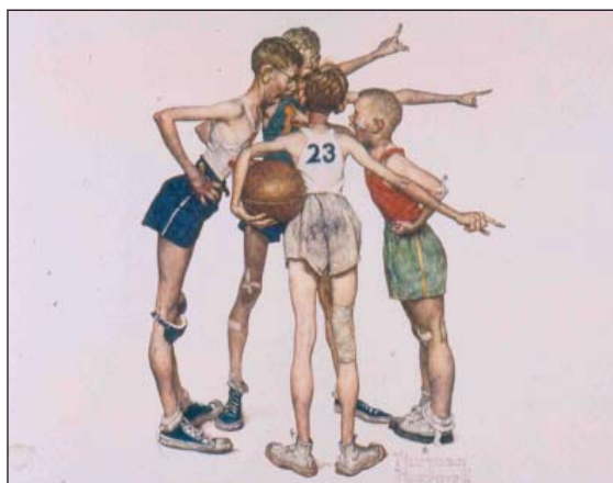
FIGURA 1. Baloncesto