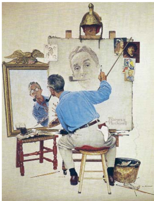
FIGURA 8. Antoretrato