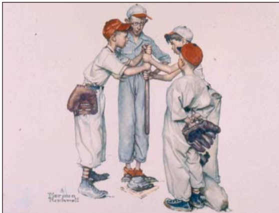
FIGURA 3. Béisbol

Durante su carrera artística, Rockwell dedicó obras a los deportes más típicamente americanos como el béisbol, el fútbol americano, el baloncesto o el golf entre otros. Norman Rockwell representa deporte, porque este es elemento esencial e intrínseco en la vida de la sociedad americana. Son circunstancias en las cuales tiene más en cuenta el aspecto social, ambiental e incluso irónico, que el aspecto deportivo. Hemos de destacar en el terreno del deporte, algunas portadas de "Saturday Evening Post" dedicadas a momentos deportivos, tratados con incomparable ironía no exenta de ternura.