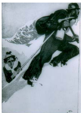
Figura 3. En la pendiente. “Si este fuera mi marido, seguro que soltaba la cuerda”