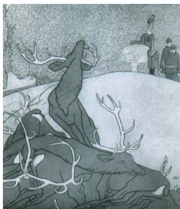
Figura 6. Caza de alta sociedad. De los periódicos. “Ha comenzado la temporada otoñal de caza. Ayer Su Alteza en una mala tarde abatió el solo doscientos ochenta y cinco ciervos salvajes”