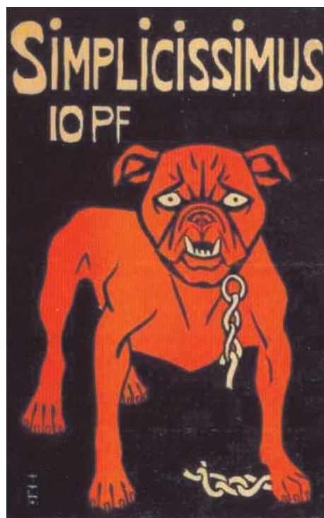
FIGURA 1. El bulldog de Simplicíssimus