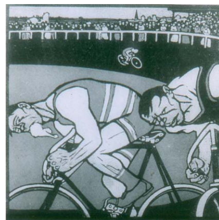
Figura 8. En el velódromo berlinés. “Ahora solo faltaría que en lugar de dinero me dieran una medalla”