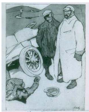
Figura 7. “Gafe”. “Ya sabía yo que si atropellaba a la víctima número 13, se escacharraría el coche”