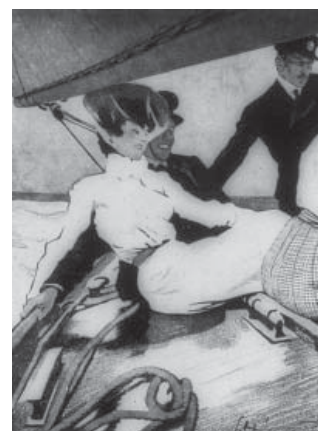
Figura 5. Hora de debilidad. “Es un hecho que la mayoría de noviajgos se ajustan en un viaje por mar.” “Muy cierto, sobre todo si una se marea y no puede defenderse”