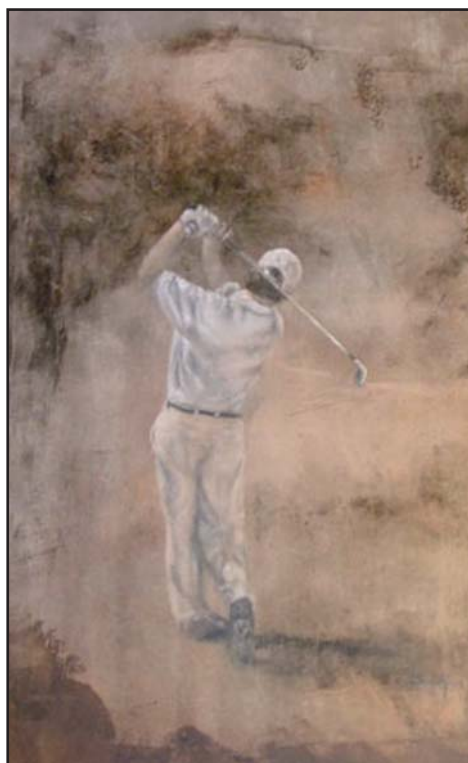
FIGURA 7. Golf

Sugerimos, de modo particular a los miembros de FEMEDE, visiten regularmente nuestra página web: www.femede.es para estar puntualmente informados.