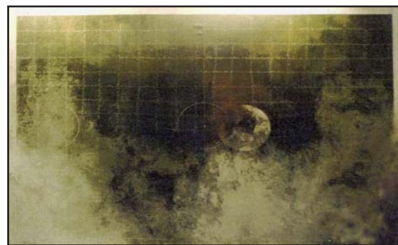
FIGURA 5. Fútbol