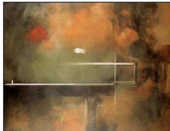
FIGURA 4. Tenis de mesa

Únicamente me referiré a los muchos premios obtenidos en concursos de arte deportivo como el Premio de Honor de la I Bienal Nacional de Arte en el Deporte (1985) , el 1er. Premio en el I Certamen Internacional de Baloncesto en las Artes Plásticas (1997) , el 2º Premio en la XII Bienal Internacional del Deporte en las Bellas Artes (1997) ,