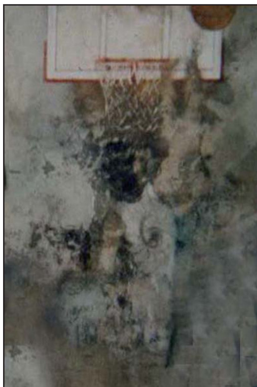
FIGURA 6. Baloncesto

Las obras reproducidas están referidas a diferentes deportes, muchos de los cuales –baloncesto, fútbol, tenis, tenis de mesa – muestran imágenes de “redes” y “mallas” que, pocas veces pueden observarse con tanta belleza y naturalidad en ejemplares pictóricos convencionales.