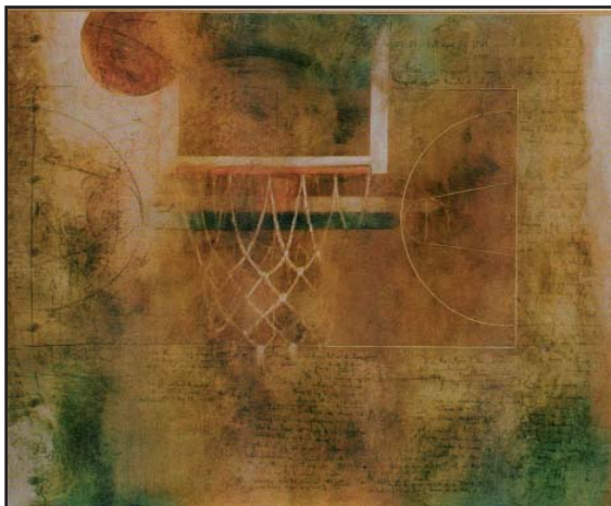
FIGURA 3. Baloncesto

y en diversos certámenes artísticos. Sus obras están especialmente dedicadas a las imágenes parciales de cuerpos femeninos púdicamente desnudos, que surgen del claroscuro y que en ocasiones se acercan a la abstracción; sus colores velados mates, sienas, negros y grises transmiten suavemente la luz a las figuras. Son inconfundibles sus naturalezas muertas, sus mesas ocupadas por delicados objetos de cerámica e incluso un piano y su partitura surgidos de una niebla profunda.