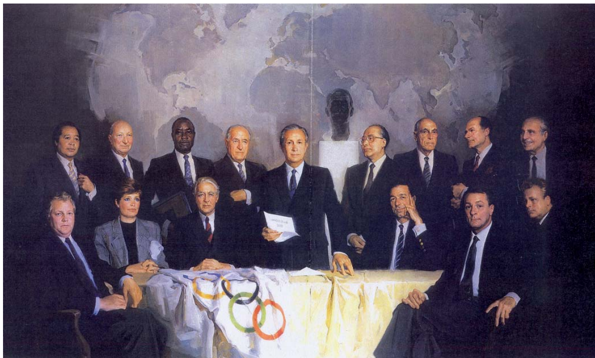
FIGURA 2. "Retratos de una Obra Universal" (Lausanne, 1988)