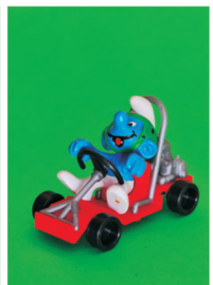
Figura 7. Kart