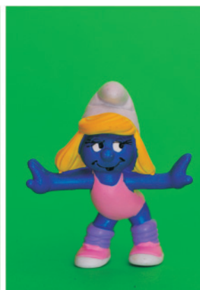
Figura 5. Pitufina Gimnástica Rítmica