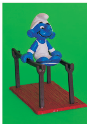
Figura 9. Gimnasta sobre paralelas

Pirlouit . Fue el 23 de octubre de 1958 el día en el que un Pitufo realizó la primera aparición en la tira, y rápidamente se hizo muy popular. Los Pitufos salieron dos veces más con Johan y Pirlouit y posteriormente protagonizaron una serie propia. Estos hechos llevaron a los Pitufos a la fama y obligaron a Peyo a abandonar todas sus series a partir de los años 70 y a dedicarse exclusivamente a “ pitufear ”. Este verbo que acabamos de utilizar, forma parte del lenguaje propio de los Pitufos . Consiste en insertar la palabra Pitufo (o su nombre concreto en otros idiomas) dentro del habla ordinaria. Los Pitufos nunca utilizan palabras malsonantes y su lenguaje únicamente lo entienden los niños.