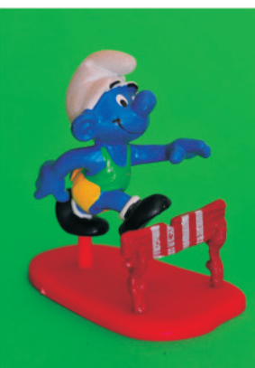
Figura 8. Corredor de vallas