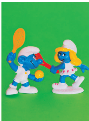
Figura 3. Tenis