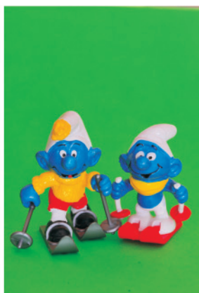
Figura 4. Esquí