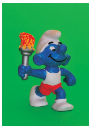
Figura 6. Llama Olímpica