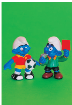
Figura 2. Fútbol