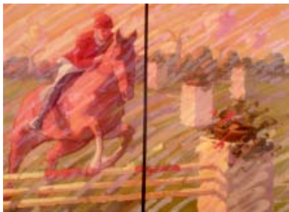
FIGURA 1.- Hípica. 1998