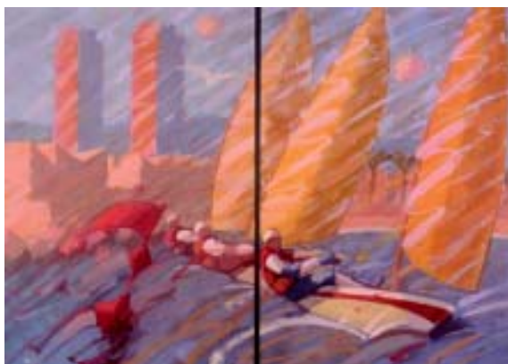
FIGURA 3.- Vela. 1998