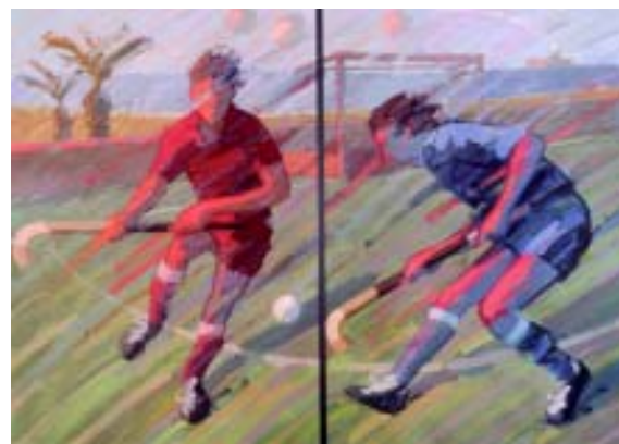
FIGURA 5.- Hockey. 1998