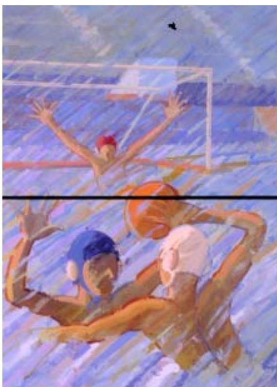
FIGURA 4.- Waterpolo. 1998