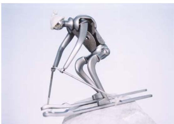
FIGURA 2. Esquí