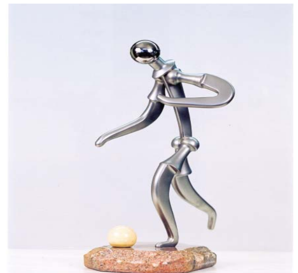
FIGURA 8. Futbolista

ción. Entre las obras se encuentran producciones de diversa índole (lámparas de sobremesa, silueta facial, una ancla, un sorprendente fakir, así como distintas representaciones de ballet) y