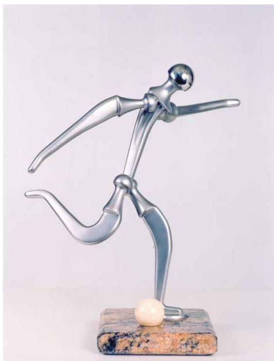
FIGURA 1. Fútbol