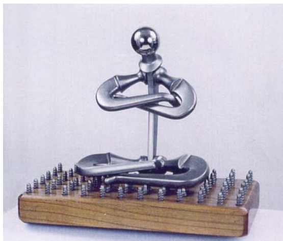
FIGURA 9. Fakir

Una visión general de las obras, indica que en su realización se han elegido numerosas y variadas piezas quirúrgicas: vástagos de cadera de Charney (los más utilizados), cúpulas acetabulares (metálicas y de polietileno), cabezas de fémur (de cerámica y de metal universal); elementos de las prótesis de rodilla, placas convencionales y placas de compresión de vitalio, vástagos de Harrington; clavos de Küntcher; tornillos de Vennable; agujas de fijador externo de Hoffmann, un destornillador de Witvoet y cemento de Hardinge y de Seidel. La mayoría de las esculturas