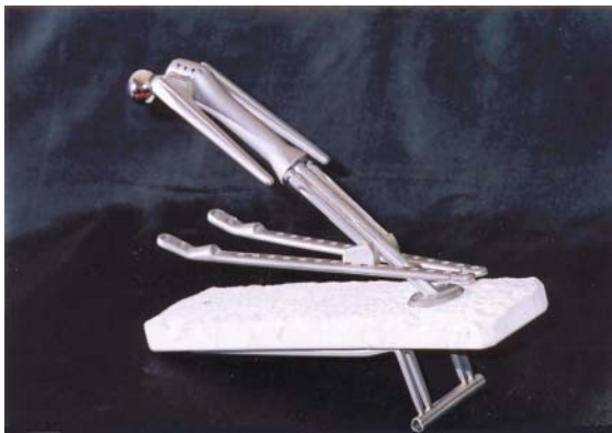
FIGURA 5. Salto esquí