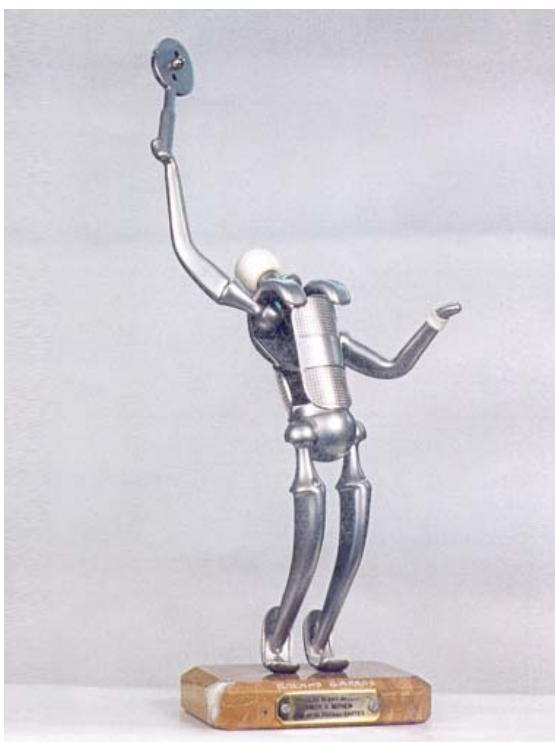
FIGURA 3. Tenis