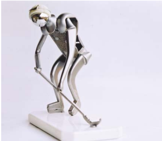
FIGURA 4. Hockey hielo