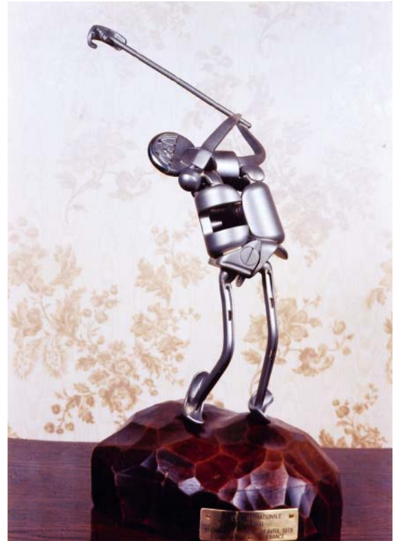
FIGURA 7. Golf