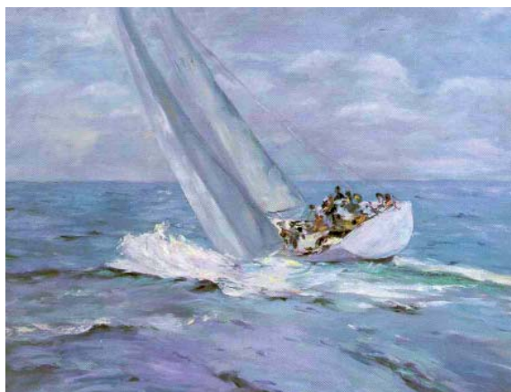
FIGURA 5. Óleo, 89 x 116 cm (1979) Escorando a babor