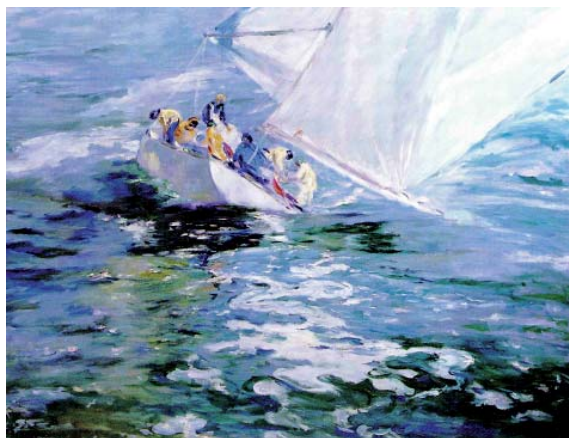
FIGURA 3. Óleo, 112 x 1050 cm (1979) Marina deportiva