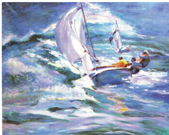
FIGURA 1. Óleo, 81 x 100 cm (1979) Regata en día turbio