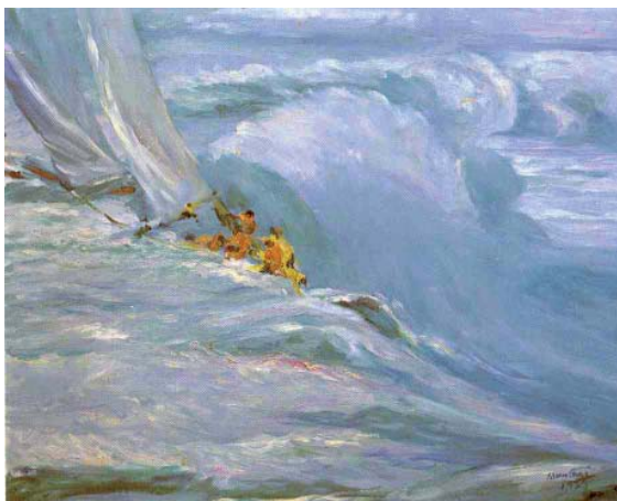
FIGURA 2. Óleo, 81 x 100 cm (1979) Barca de vela en mar brava