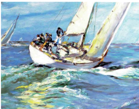
FIGURA 4. Óleo, 65 x 81 cm (1980) Regata