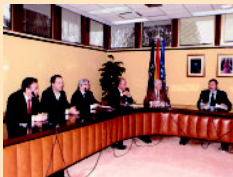
FEMEDE en el CSD