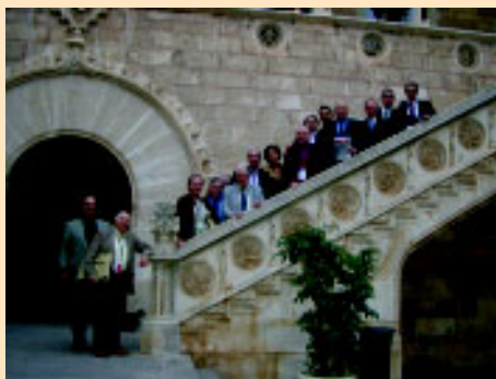
Algunos participantes en la Asamblea Anual de FEMEDE'05