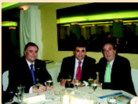
Dres. Iturri y Roig con el Director de Deportes de Baleares