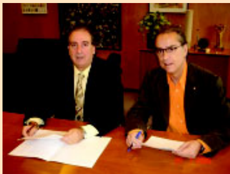
Firma del Convenio entre FEMEDE y el Ayuntamiento de Barcelona para la organización del Congreso FIMS 2008.