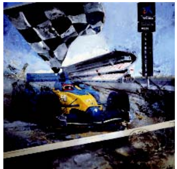
FIGURA 6. Incompatibilidad de medios s/lino 195 x 195 cm