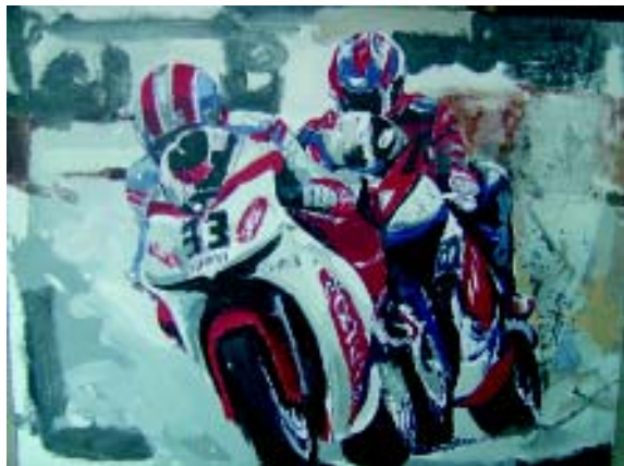
FIGURA 7. Incompatibilidad de medios s/lino 89 x 116 cm