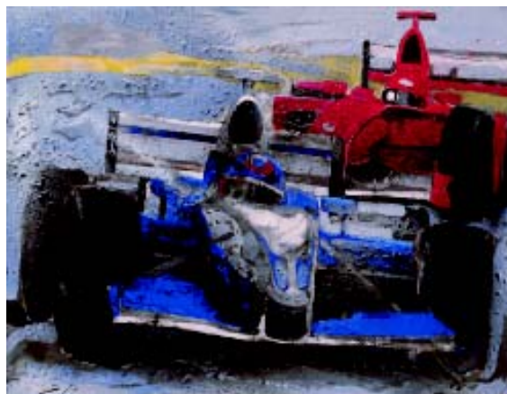
FIGURA 2. Incompatibilidad de medios s/lino. 89 x 116 cm