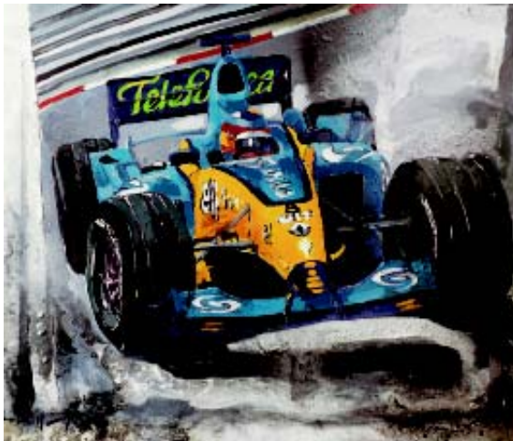
FIGURA 3. Incompatibilidad de medios s/lino 89 x 116 cm