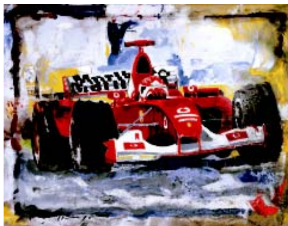
FIGURA 1. Incompatibilidad de medios s/lino. 89 x 116 cm