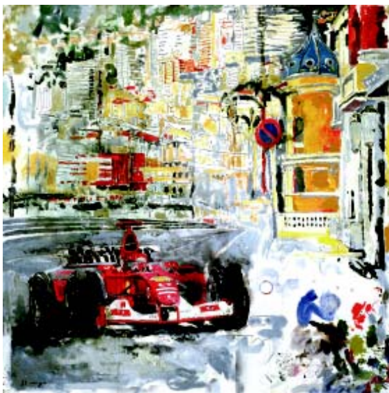
FIGURA 4. Incompatibilidad de medios s/lino 195 x 195 cm