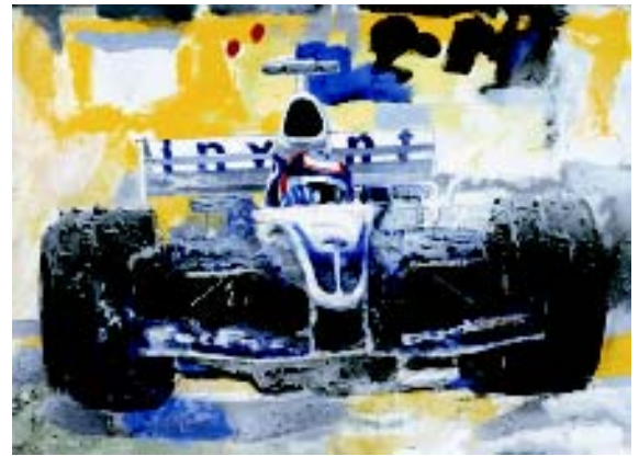
FIGURA 5. Incompatibilidad de medios s/lino 89 x 116 cm