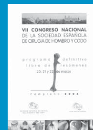
Edita: Sdad. Española de Cirugía del Hombro y del Codo, Pamplona 2003. 162 páginas