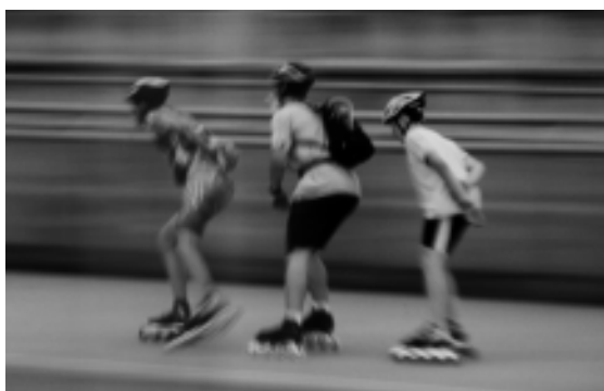
FIGURA 2.- Posición retrasada del patinador seguido