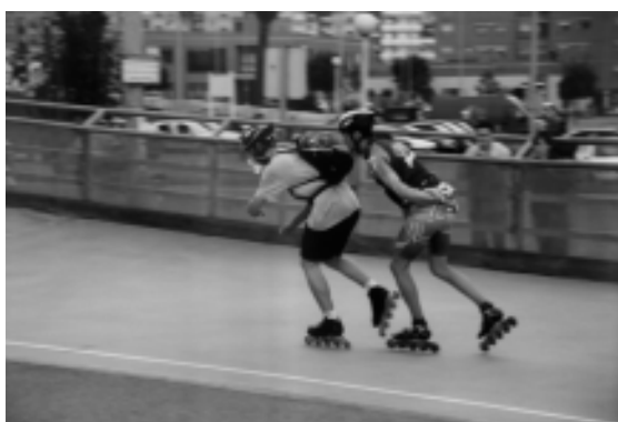
FIGURA 1.- Posición delantera del patinador estudiado

Con los datos obtenidos, se realizó un estudio estadístico utilizándose el test de Wilcoxon, usando para su análisis el paquete informático SPSS.